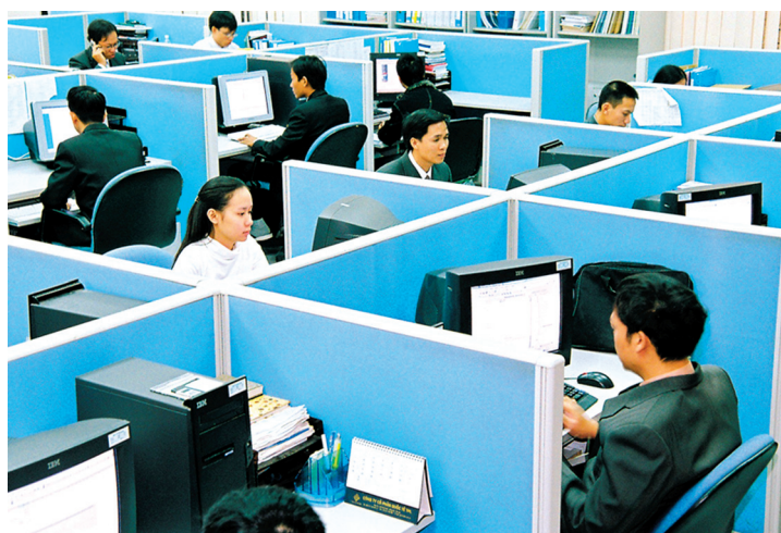
Cổng thông tin WTO-Hội nhập sẽ hỗ trợ DN trong đàm phán thương mại quốc tế

Cổng thông tin điện tử WTO - Hội nhập tại địa chỉ www.trungtamwto.vn (phiên bản tiếng Việt) và www.wtocenter.vn (phiên bản tiếng Anh) đã được Phòng Thương mại và Công nghiệp Việt Nam (VCCI) chính thức khai trương. Đây sẽ là đầu mối cung cấp đầy đủ, hệ thống văn bản pháp lý, thông tin cập nhật, ấn phẩm, tài liệu về WTO, các hiệp định thương mại quốc tế mà Việt Nam đã hoặc đang đàm phán ký kết cũng như các vấn đề pháp lý trong hội nhập kinh tế quốc tế. Đồng thời, là kênh tư vấn, trao đổi, chia sẻ và hỗ trợ trực tuyến cho các doanh nghiệp, hiệp hội về WTO và chính sách pháp luật thương mại quốc tế; là nơi trao đổi thông tin, thảo luận về các hoạt động của Ủy ban Tư vấn về chính sách thương mại quốc tế và các hoạt động khác của Chương trình “Doanh nghiệp và chính sách thương mại quốc