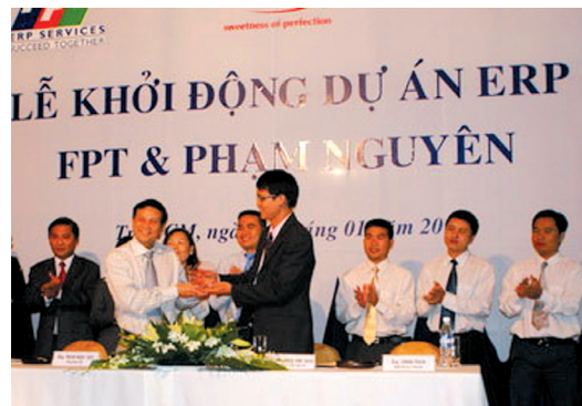
Công ty Bánh kẹo Phạm Nguyên và FIS khởi động dự án triển khai ERP trên nền tảng Oracle

Dự án sẽ triển khai được tại trụ sở chính và thêm 5 chi nhánh của công ty Phạm Nguyên. Công ty Phạm Nguyên tin rằng dự án sẽ đem lại hiệu quả kinh tế cao, quản lý trở nên tập trung hơn, trong đó quan trọng nhất là tài chính công ty sẽ được minh bạch. Ban quản trị công ty sẽ theo dõi được hàng ngày những biến chuyển và sự phát triển trong công việc kinh doanh.