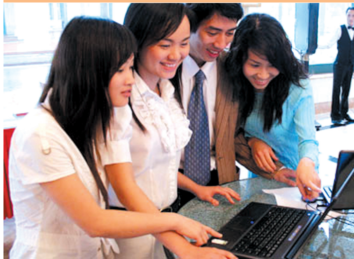
Với dịch vụ thanh toán qua mạng thông qua NH điện tử, người dân có thể nộp tiền điện, nước...qua mạng.

Nhiều đại diện doanh nghiệp thương mại điện tử (TMĐT) Việt Nam cho rằng, Việt Nam nên phát triển thanh toán điện tử bằng cách Nhà nước đứng ra thành lập và quản lý cổng thanh toán điện tử trực tuyến bằng thẻ thanh toán ATM, thu phí thấp để hỗ trợ doanh nghiệp (DN) vừa và nhỏ phát triển TMĐT.