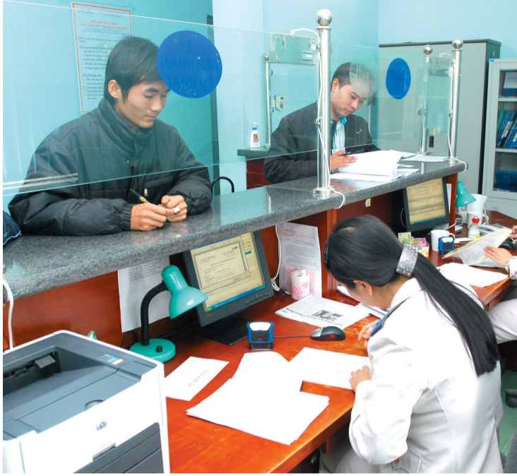
Chi cục Hải quan quản lý hàng tự gia công, Hải quan Hà Nội.

Thông qua việc áp dụng thủ tục hải quan điện tử, cơ quan hải quan đã hỗ trợ cho doanh nghiệp (DN) trong việc khai báo, thông quan hàng hóa nhanh chóng, số liệu giữa cơ quan hải quan và DN được